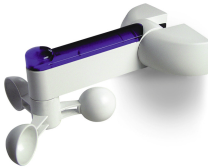
Automatisme NiceScreen vent/soleil