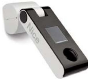
Automatisme NiceScreen soleil/pluie