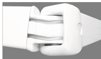
Tension des bras par double câble gainés pour les stores

Pour les versions motorisées, les moteurs et l'ensemble des automatismes sont garantis 2 ans.