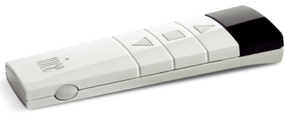
Télécommande NiceScreen Ergo 1