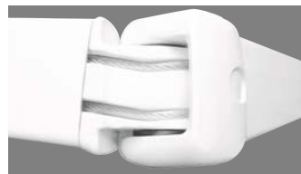
Tension des bras par double câble gainés pour tous les stores