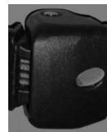
Tension des bras par 4 câble gainés pour les stores à avancée supérieure à 3500mm

LA PROTECTION SOLAIRE ADAPTÉE A VOS BESOINS