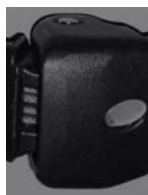
Tension des bras par 4 câble gainés pour les stores à avancée supérieure à 3500mm

Pour les versions motorisées, les moteurs et l'ensemble des automatismes sont garantis 2 ans.