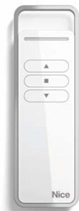
Télécommande NiceScreen Era-P1