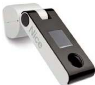
Automatisme NiceScreen soleil/pluie