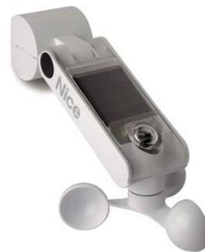
Automatisme NiceScreen vent/soleil à cellules photovoltaïques