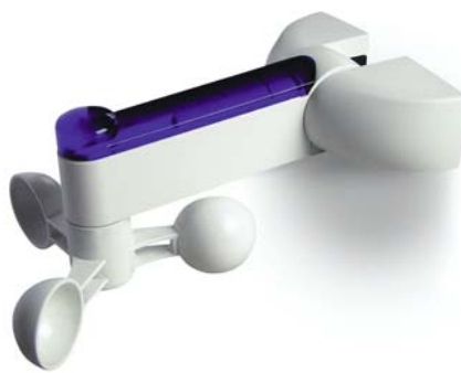
Automatisme NiceScreen vent/soleil