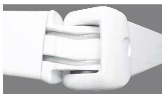
Tension des bras par double câble gainés pour tous les stores